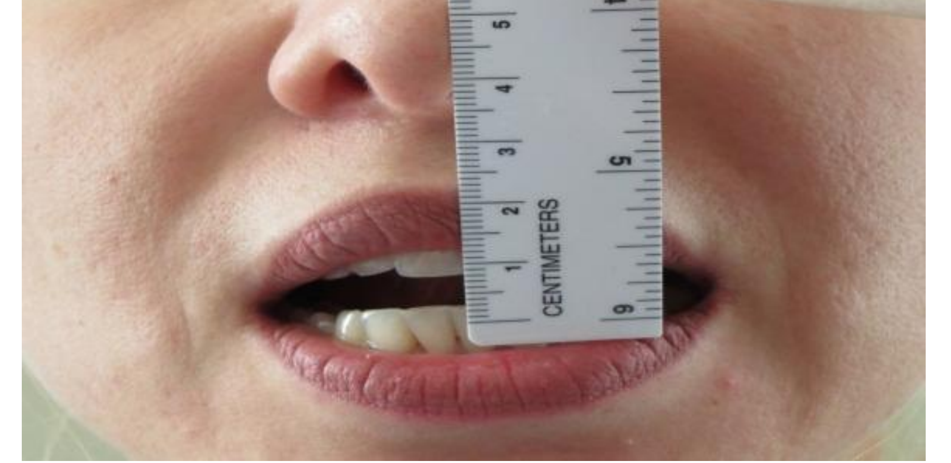
Reduced mouth opening मुँह का कम खुलना